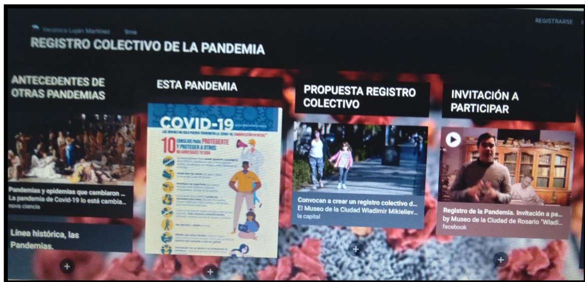
Imagen de parte del Muro de Padlet

Se contaba con una escala de rango o planilla de seguimiento donde se evaluó y observó el resultado que brindó cada estudiante. La serie de indicadores con que se contaba para evaluar a cada uno de los alumnos en particular era: participación, desempeño en la actividad propuesta, y envío de actividades a término.