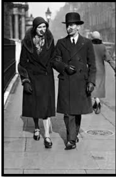
Contrastes y similitudes con la fiebre española Imagen incluida en el Padlet

Pensando en la reformulación la actividad presentada no tuvimos en cuenta que, ya teníamos en el Muro de Padlet material e información para ser analizadas con más detalle como la referencia sobre otras pandemias a lo largo de la historia, así como imágenes fotográficas y pinturas. Centrándose más en ellas también se habría haber planteado la problemática que no es la primera pandemia que vivió la humanidad ya que a lo largo del tiempo hubo otras épocas difíciles como las que nos toca en el presente, pero a pesar de ello el mundo siempre salió adelante. Utilizando este camino quizás se hubiera podido haber dado una visión más positiva y así aliviar un poco el sentimiento de angustia, de temor y de estrés entre otros que se plasmó fehacientemente en sus palabras testimoniales.